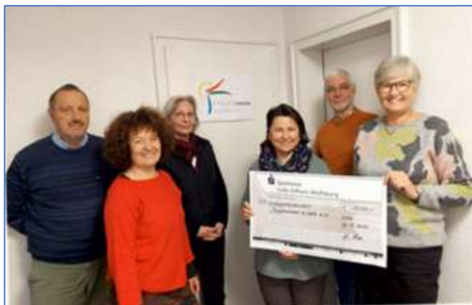
Abbildung 16: Vorstand plus Projektleitungen (1. Reihe) 2024 – 2025

Nach Rücktritten wurde ein bis Februar 2026 befristeter Interimsvorstand gewählt mit den Hauptaufgaben, die laufenden Geschäfte weiterzuführen und Kandidaten und Kandidatinnen für einen dauerhaften Vorstand zu gewinnen.