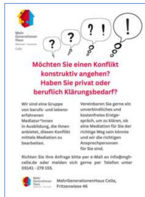
Abbildung 2 und 3: Beratungsangebote in unterschiedlichen Formaten- Workshops zu Lebensfragen