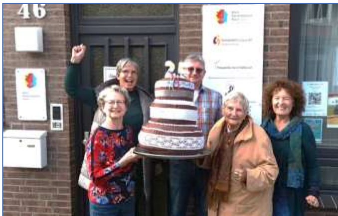
Abbildung 13: Jubiläum in 2024, 25 erfolgreiche Jahre

Der Verein wurde unter dem Namen FRAUENräume in Celle e.V. am 28.10.1999 gegründet, um Frauen Räume für Begegnung, Bildung und gesellschaftliche Teilhabe zu eröffnen – mit dem Ziel, Selbstbestimmung sowie die im Grundgesetz verankerte Gleichstellung der Geschlechter zu fördern und frauenpolitisches Engagement sichtbar zu machen.