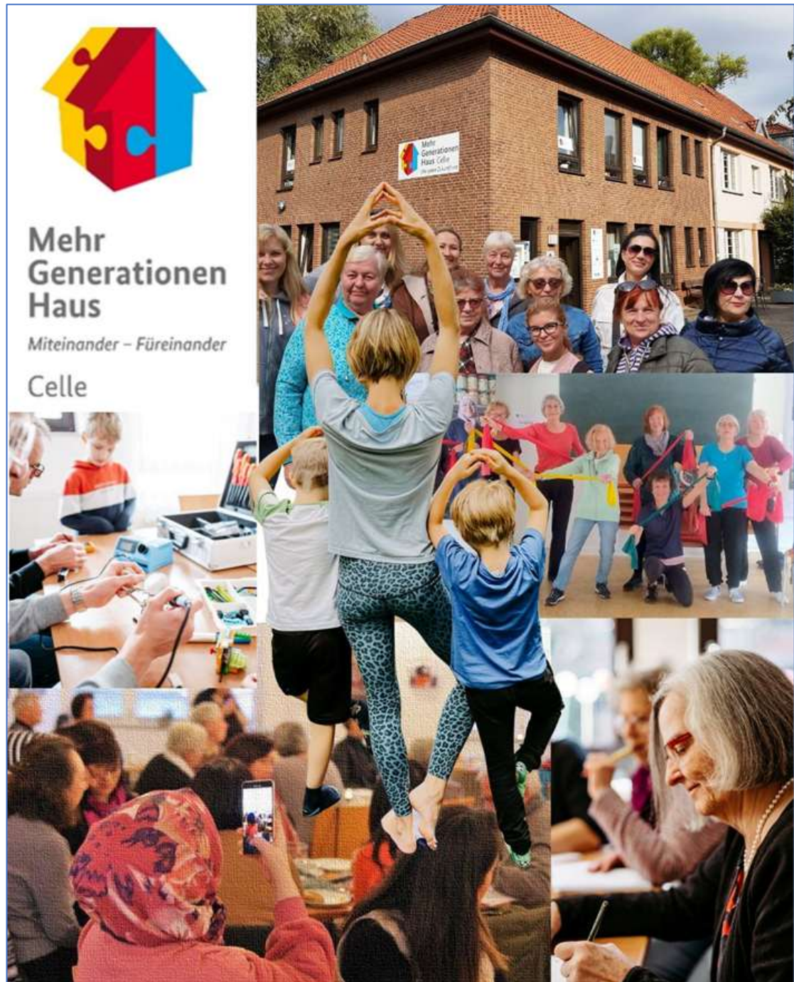
Abbildung 7: Vielfalt