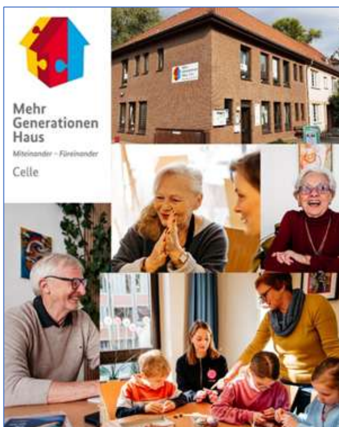
Abbildung 1: Generationen im MGH

So bietet ein Formularlotse ehrenamtlich einmal die Woche – jeweils am Dienstag – seine Unterstützung an. Die Internetseite des MGH wird von einer Ehrenamtlichen gepflegt. Auch entstehen viele Aktivitäten spontan, so wie Zeit freiwillig eingebracht wird.