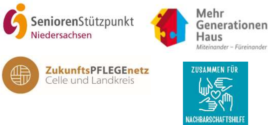
Abbildung 14: Die größten Projekte

Der Verein hat in seiner Trägerschaft verschiedene soziale Institutionen aufgebaut, die in die Stadt Celle und in deren Umfeld hineinwirken. Dazu gehört seit 2005 mit unterschiedlichen Fördermöglichkeiten das MehrGenerationenHaus Celle (MGH), im Bereich Senioren seit 2008 der SPN-Seniorenstützpunkt, im Bereich Pflege seit 2020 das ZukunftsPFLEGEnetz Celle und Landkreis (ZPN) und seit 2024 das Projekt „Zusammen für Nachbarschaftshilfe“.