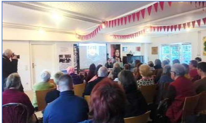
Abbildung 4: Zum Internationalen Frauentag 2025, Vortrag „Jin Jyian Azadi – die Errungenschaften der Frauenrevolution“ mit rahmengebender Ausstellung „Frauen Leben Welten“ im MGH