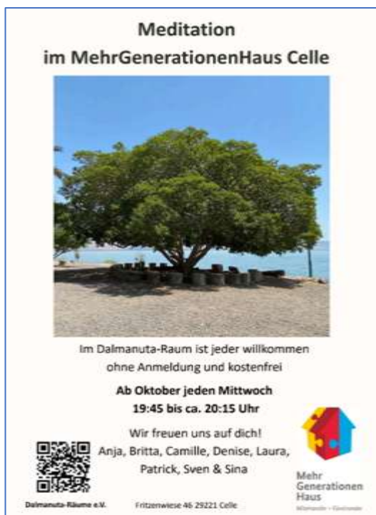
Abbildung 5: Meditation unter Anleitung von Celler Yogalehrerinnen und -lehrern